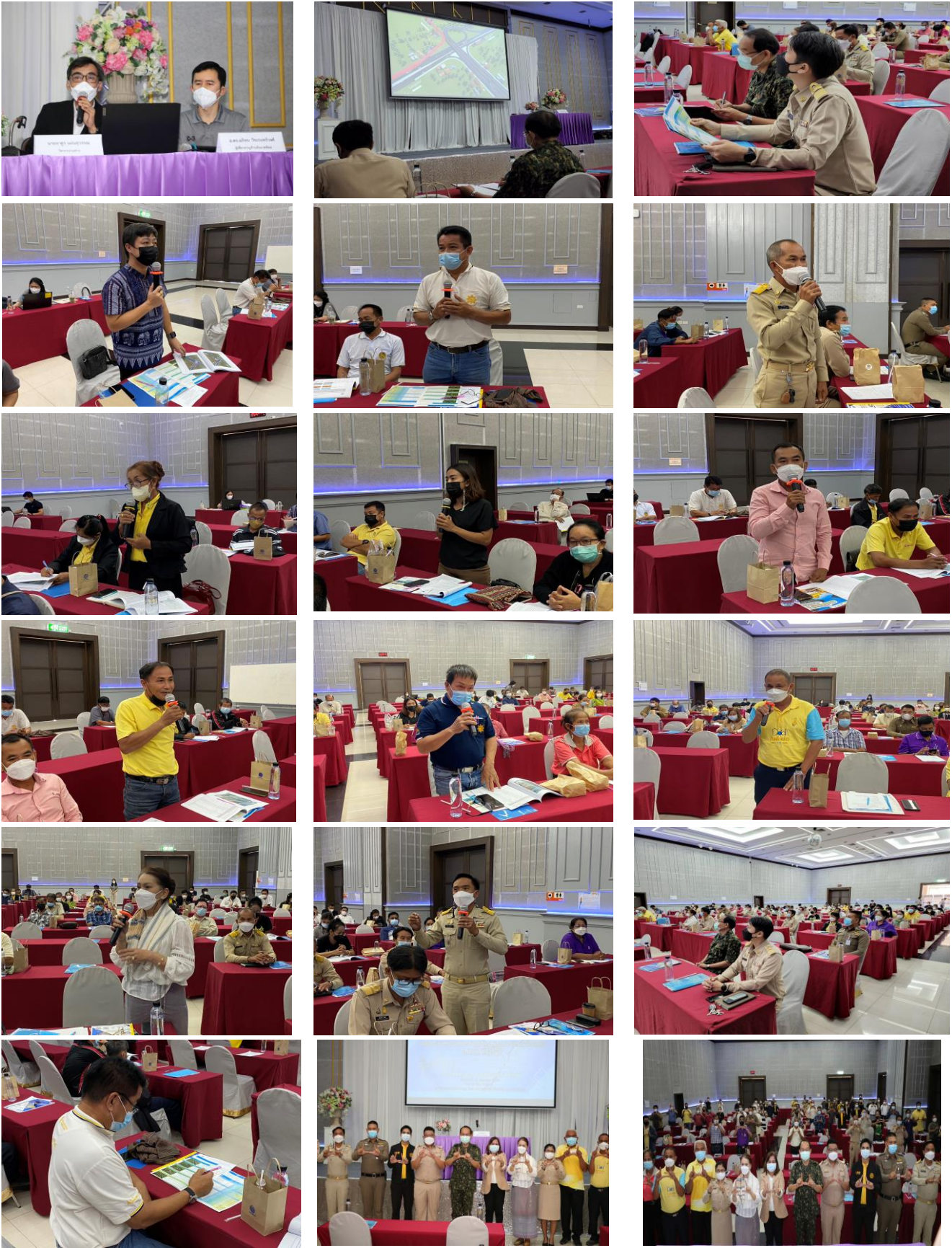
บรรยากาศการประชุมสรุปผลการคัดเลือกรูปแบบการพัฒนาโครงการ (สัมมนา ครั้งที่ ๒)